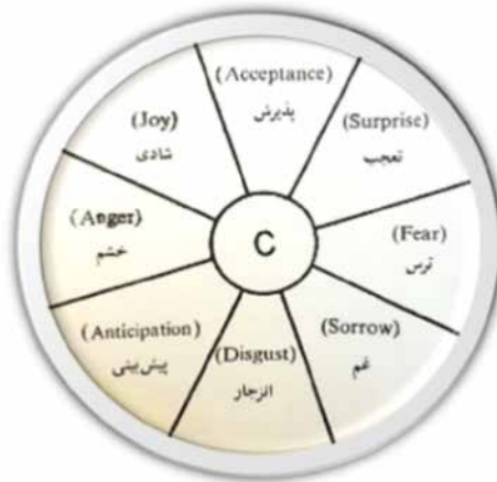
شکل ۱. برش عرضی از ساختار هیجانی پلاچیک (۱۹۶۲)

پلاچیک اصول موضوعی در نظریه خود را بیان می‌کند که به این شرح است: اصل (۱): تعداد اندکی از هیجان‌ها خالص یا اولیه وجود دارند. اصل (۲): انواع هیجان‌ها با یکدیگر مرتبط هستند؛ یعنی می‌توانند از اجزای مرحله هیجان‌ها اولیه ترکیب شوند. اصل (۳): هیجان‌ها اولیه از نظر فیزیولوژی و رفتار از یکدیگر متمایز می‌شوند. اصل (۴): هیجان‌ها به شکل خالص خود، مفاهیم ذهنی فرضی و یا حالت ایده‌آلی است که خواص آنها را با استفاده از انواع شواهد مختلف می‌توان استنباط کرد. اصل (۵): هیجان‌های اولیه را می‌توان برحسب زوج‌های متضادی که در دو قطب قرار دارند، بیان کرد. اصل (۶): هر یک از هیجان‌ها ممکن است در درجات مختلفی از شدت یا میزان برانگیختگی بروز کند. (پلاچیک، ۱۹۶۲: ۵۵) نظریه پلاچیک به دلیل ارائه یک مدل ساختاری برای تحلیل هیجان‌های انسانی، ابزاری قدرتمند برای بررسی آیات قرآنی فراهم می‌کند. طبق اصل (۱)، پلاچیک هیجان‌های اصلی و اولیه را هشت هیجان معرفی کرده است که در شکل زیر نشان داده شده است (همان: ۱۳۴).